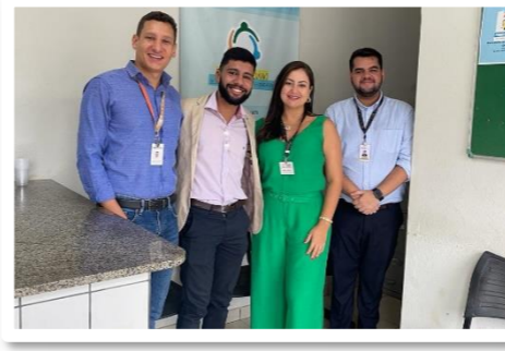
Visita técnica no PAPRE em Marilac/MG