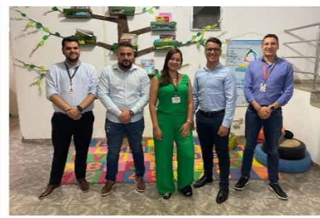
Visita técnica no PAPRE de São Geraldo da Piedade/MG