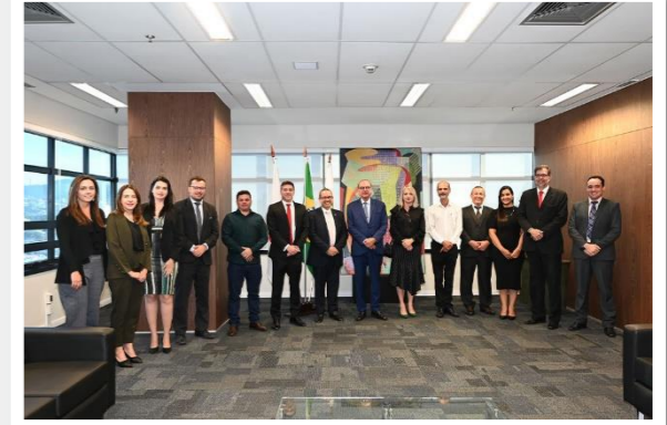
A instalação de Postos de Atendimento Pré-Processual nos municípios auxiliará em demandas relacionadas à defesa do consumidor, especialmente para atendimento aos superendividados

O Tribunal de Justiça de Minas Gerais assinou, no dia 4/6, termos de cooperação técnica com os municípios de João Monlevade, Vazante e Ponte Nova para a instalação de unidades do Posto de Atendimento Pré-Processual (Papre) nos órgãos de Proteção e Defesa do Consumidor (Procon) dessas cidades. A parceria prevê a atuação em demandas relacionadas à defesa do consumidor, especialmente, para atendimento aos superendividados.