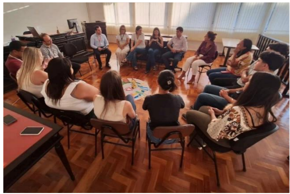
Instituições que compõem o sistema de justiça participaram do círculo

A 3ª Vice-Presidência do Tribunal de Justiça de Minas Gerais (TJMG) realizou, entre os dias 14/5 e 16/5, visitas técnicas presenciais aos Centros Judiciários de Solução de Conflitos e Cidadania (CEJUSCs) das comarcas de Juiz de Fora e Rio Preto, localizadas na Zona da Mata Mineira.