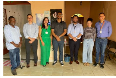
Visita técnica no PAPRE em Frei Inocêncio/MG