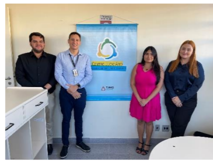
Guapé dia 20/05/2024 Colaboradores do CEJUSC, SEANUP e AGIN