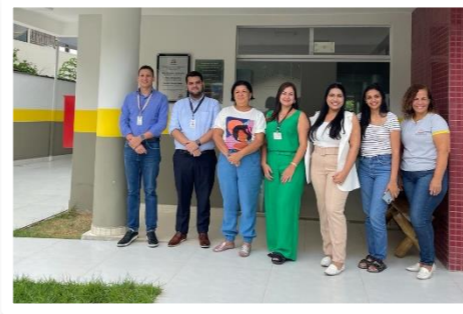
Visita técnica no PAPRE em Mathias Lobato/MG