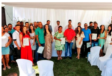
Iniciativa do CEJUSC de Porteirinha contemplou 18 casais no município