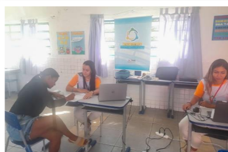
Atendimento realizado pelo Centro Judiciário de Solução de Conflitos e Cidadania (CEJUSC) de Porteirinha