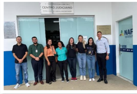
Equipe do Cejusc da universidade Univale e equipe do Seanup