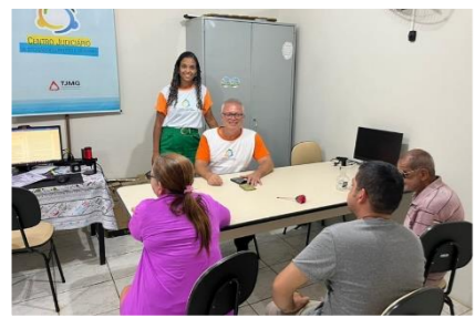
Sessão de conciliação realizada pela equipe do CEJUSC em Mato Verde