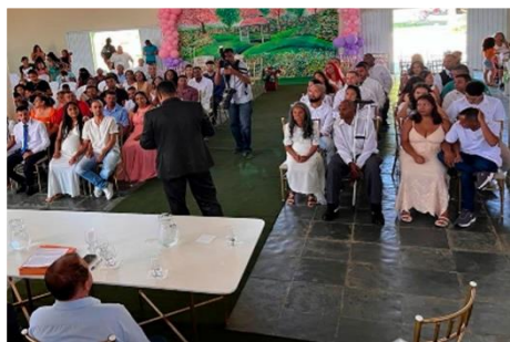
Vinte e seis casais participaram de casamento comunitário na Comarca de Januária