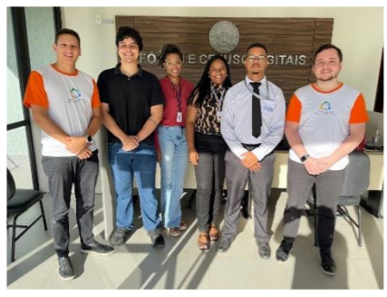
Padre Paraíso dia 23 e 24/04/2024 Equipe do SEANUP e equipe do Fórum e CEJUSC Digitais.