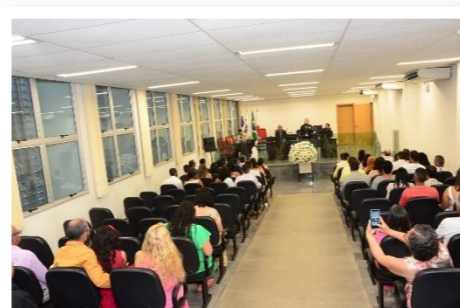
Mutirão de conversão de união estável em casamento ocorreu entre os dias 22/4 e 3/5