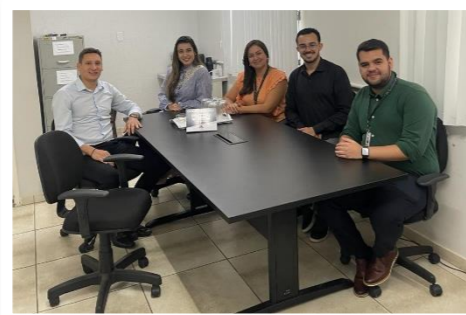
Visita técnica no PAPRE em Periquito/MG