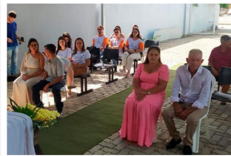
Cerimônia de casamento comunitário realizada dia 23/5, em São João do Manteninha