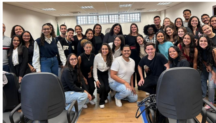
Alunos do 6º período do Curso de Direito da UEMG