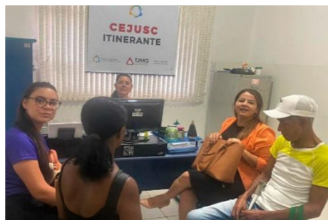
Sessão conciliatória feita pelo Cejusc Itinerante da Comarca de Coração de Jesus