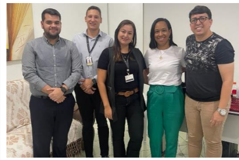
Visita técnica no PAPRE em Alpercata/MG