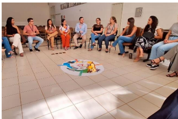
Instituições que compõem o sistema de justiça participaram do círculo

A 3ª Vice-Presidência realizou, entre os dias 31/1 a 2/2, visitas técnicas presenciais aos Centros Judiciários de Solução de Conflitos e Cidadania (Cejusc) das comarcas de Iturama, Campina Verde e Itapagipe, localizadas no Triângulo Mineiro.