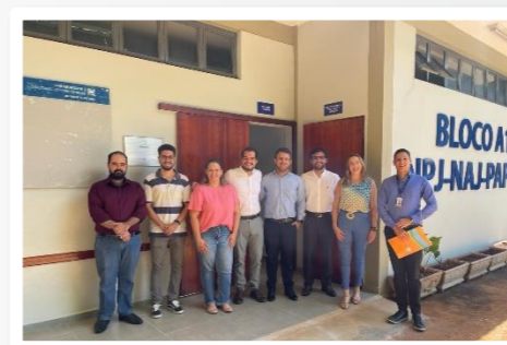
Gestores da UEMG, equipe do PAPRE e colaboradores do SEANUP