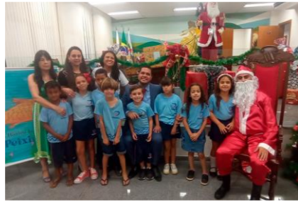
No Fórum de Caratinga, as crianças foram recebidas pelo Papai Noel e receberam presentes