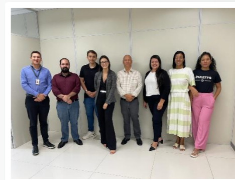
Equipe do CEJUSC de Ituiutaba e colaboradores do SEANUP

A equipe da Terceira Vice-Presidência também realizou visitas nos Postos de Atendimento Pré-Processuais (Papres) vinculados a Comarca de Ituiutaba, instalados na Universidade do Estado de Minas Gerais – UEMG e na Faculdade Mais de Ituitaba – FacMais.