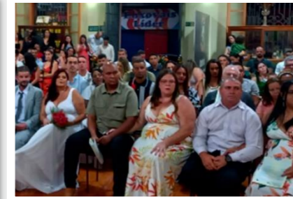
Noivos, padrinhos e convidados para a cerimônia de casamento comunitário em Reduto

O Centro Judiciário de Solução de Conflitos e Cidadania (Cejusc) de Manhuaçu realizou, no segundo semestre de 2023, dois casamentos comunitários. O primeiro ocorreu na Casa de Cultura de Manhuaçu e, o segundo, no Auditório da Faculdade de Direito e Ciências Sociais do Leste de Minas (Fadileste), no município de Reduto.