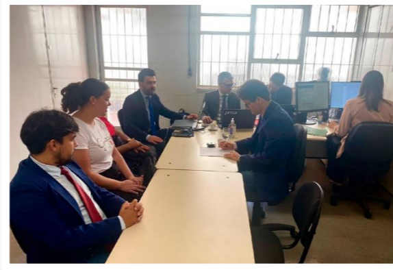
A 8ª etapa do Mutirão de Conciliação em Brumadinho foi realizada nos dias 22/5 e 23/5

O Tribunal de Justiça de Minas Gerais (TJMG) encerrou, no dia 23/5, a 8ª fase do Mutirão de Conciliação em Brumadinho, na Região Metropolitana de Belo Horizonte. A iniciativa, que começou na quarta-feira (22/5), foi realizada no Centro Judiciário de Solução de Conflitos e Cidadania (CEJUSC) do Fórum José Altivo do Amaral. Houve 109 audiências, envolvendo 120 autores, e homologados 118 acordos, resultando em um êxito de 98%. Outras duas audiências foram redesignadas.