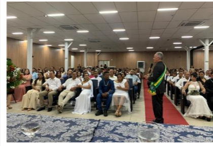
Casamento comunitário na Comarca de Itabirito

O Centro Judiciário de Soluções de Conflitos e Cidadania (CEJUSC) da Comarca de Itabirito, na região Central do Estado, realizou, em 11/05, uma cerimônia de casamento comunitário para conversão da união estável de 88 casais do município.