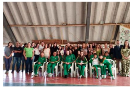
Em São João del-Rei, o Projeto Dialogar incentivou a busca pela solução de conflitos no ambiente escolar

O "Projeto Dialogar", uma iniciativa conjunta do Centro Judiciário de Solução de Conflitos e Cidadania (Cejusc) da Comarca de São João del-Rei e da Secretaria Municipal de Educação, teve início em 15/9/2023, marcando um compromisso significativo com a promoção do conhecimento e a disseminação da cultura da paz entre os alunos da rede pública de ensino municipal.