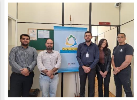
Jaboticatubas dia 25/06/2024 Equipe do CEJUSC e do SEANUP.