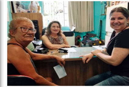
A coordenadora do Cejusc de Montes Claros, juíza Rozana Siqueira Paixão, em atendimento ao público

O Cejusc de Montes Claros, com o apoio do Rotary Club Leste, da Prefeitura Municipal de Montes Claros e do Centro de Referência Social (Cras), promoveu a ação "Transformando Conflitos em Diálogos" na Escola Estadual Carlos Albuquerque.