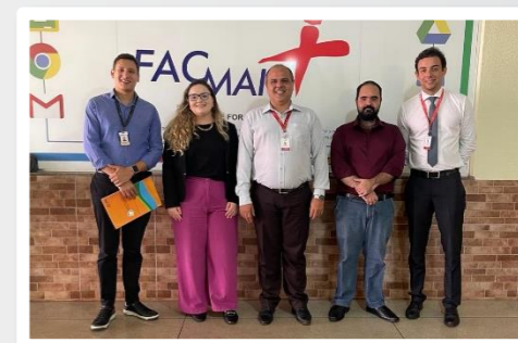
Gestores da FacMais, equipe do PAPRE e colaboradores do SEANUP