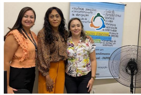
Visita técnica no PAPRE em Periquito/MG