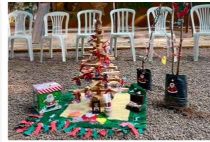
Na Comarca de Sabará foi realizado o primeiro círculo de construção de paz do Cejusc e da história da cidade

Após receberem capacitação como Facilitadoras de Círculos de Construção de Paz, promovida pela 3ª Vice-Presidência, em parceria com a Escola Judicial Desembargador Edésio Fernandes (Ejef), as servidoras da Comarca de Sabará iniciaram a atuação conduzindo o primeiro círculo de construção de paz do Cejusc e da história de Sabará.