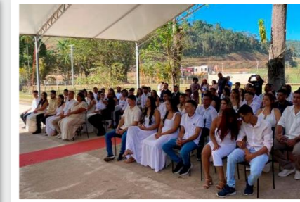
Cerimônia converteu a união estável de 33 casais de Ervália

O Centro Judiciário de Soluções de Conflitos e Cidadania (CEJUSC) da Comarca de Ervália, na região da Zona da Mata Mineira, realizou, no dia 18/5, a terceira edição da cerimônia de conversão de união estável em casamento civil. O evento contemplou 33 casais do município.