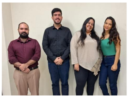
Leopoldina dia 05/06/2024 - Colaborador do SEANUP (esq.), com a equipe do CEJUSC de Leopoldina.