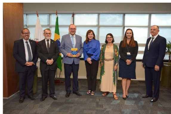
O documento digital estará disponível na página da 3ª Vice-Presidência, no portal do TJMG