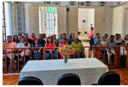
Evento contemplou 67 casais dos municípios integrantes da Comarca de Guarani, na Zona da Mata, promoveu o 1º Mutirão de Conversão de União Estável em Casamento, contemplando 67 casais dos municípios integrantes da comarca (Piraúba e Guarani).

O Tribunal de Justiça de Minas Gerais (TJMG), por meio do Centro Judiciário de Solução de Conflitos e Cidadania (CEJUSC) da Comarca de Guarani, na Zona da Mata, promoveu o 1º Mutirão de Conversão de União Estável em Casamento, contemplando 67 casais dos municípios integrantes da comarca (Piraúba e Guarani). A cerimônia ocorreu em 11/4, no espaço do Salão do Júri de Guarani, onde foram entregues as certidões de casamento aos participantes.