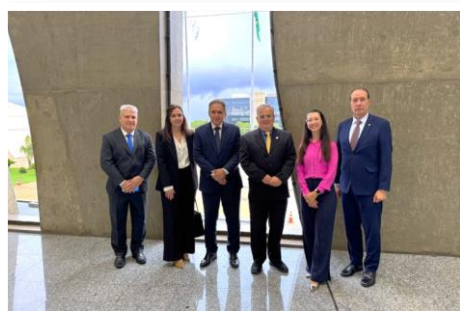
CRÉDITO TJMG: DIVULGAÇÃO

3ª Vice-Presidência do TJMG tem enunciados aprovados no 1º Congresso do STJ da Primeira Instância Federal e Estadual